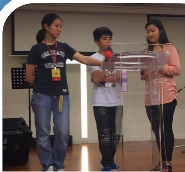
杰祐～大突破回應信息