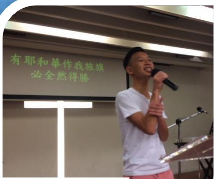
豐甫第一次帶敬拜