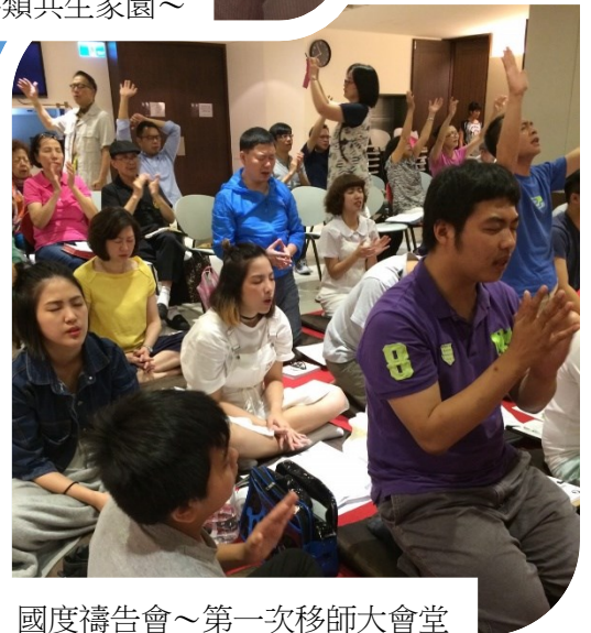
國度禱告會～第一次移師大會堂